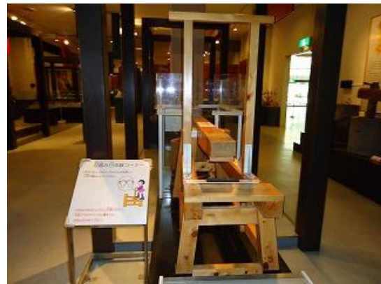
農業科学体験コーナー